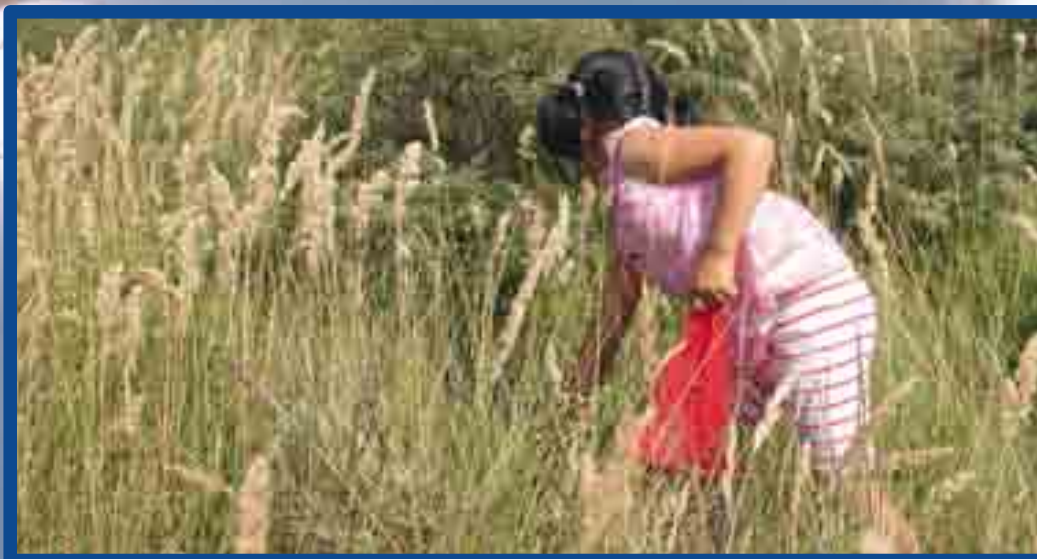
tekst & foto: Mandy Schoorl